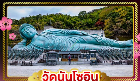
วัดนินโซอิน