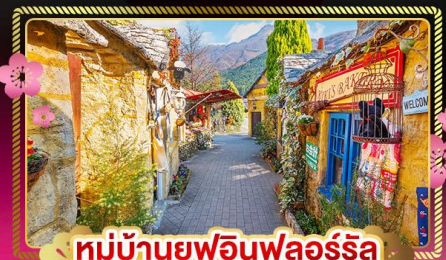
หมู่บ้านยูฟูอินฟลอร์ริล