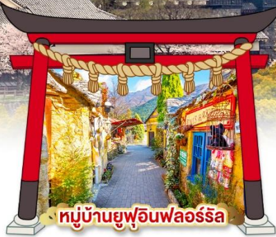
หมู่บ้านยูฟุอินฟลอร์ริล