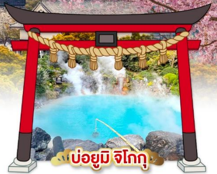
บ่อยูมิ จิโกกุ