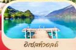
อิชเลทวอลด์