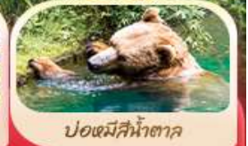
ป้อมหมีสีน้ำตาล