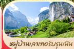
หมู่บ้านเลาเทอร์บรุนเนน