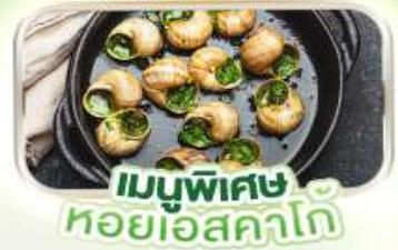
เมนูพิเศษ หอยแอสคาโต้

พิเศษ ล่องเรือแม่น้ำแซนชมเมือง โดย บาโต มูช