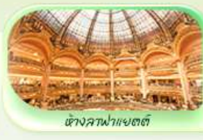
ห้างสรรพสินค้า