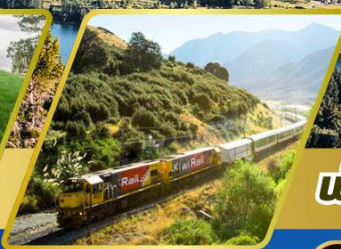
นั่งรถไฟทรานซ์ อัลไพน์