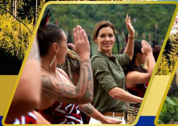
หมู่บ้านเมารี