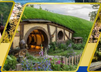
บ้านฮอบบิต