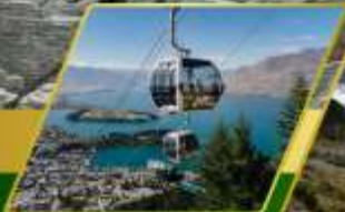
นั่งกระเช้าคอนโดลล่า รับประทานอาหาร บนยอดเขานิวฟัน