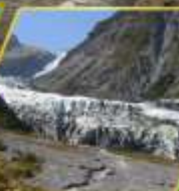
ธารน้ำแข็ง FOX GLACIER