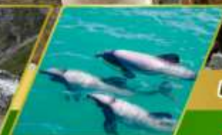
ส่องเรือชมโลมา อ่าวอาคารัว