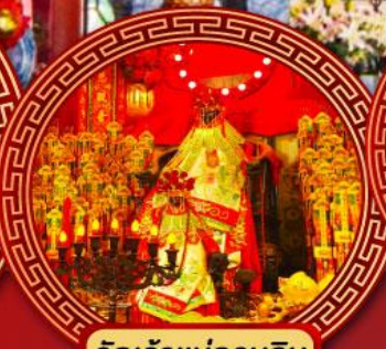
วัดเจ้าแม่กวนอิมฮ่องฮ่า