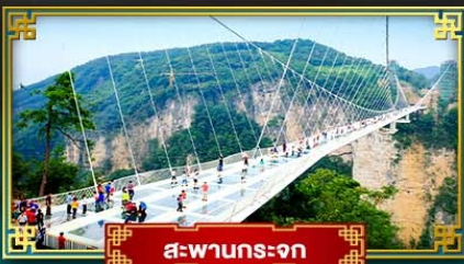
สะพานกระเจก

สัมผัสบรรยากาศหมู่บ้านโบราณ ชมหุบเขาอวดตาร