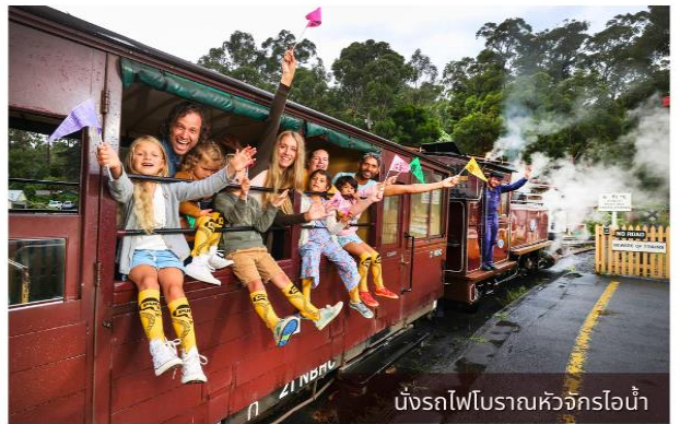
นั่งรถไฟโบราณหัวจักรไอน้ำ