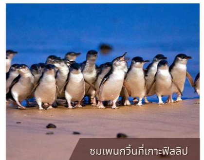
ชมเพนกวินที่เกาะฟิลลิป