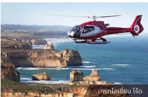
เกรทโอเชียน ไรด์