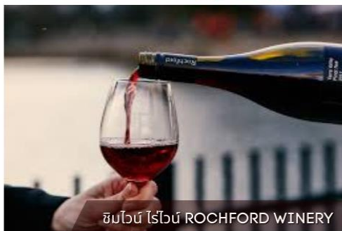
ชิมไวน์ ไร่องุ่น ROCHFORD WINERY