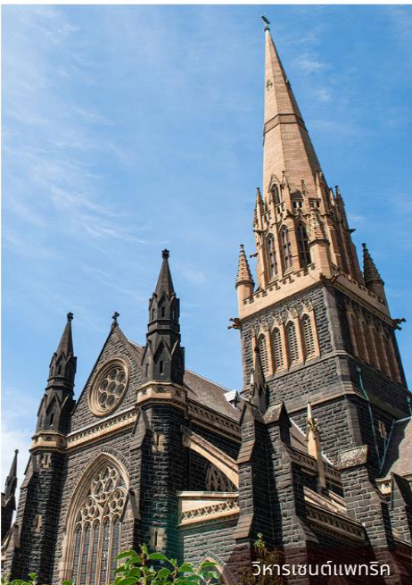
วิหารเซนต์แพทริก