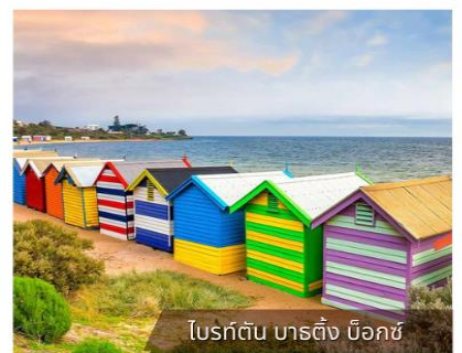
โบสถ์สีสดใส บาร์ติง ซีโอกซ์