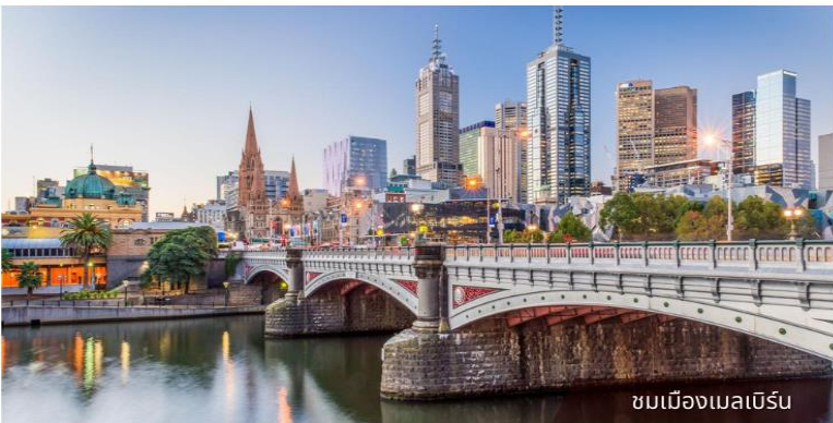
ชมเมืองเมลเบิร์น