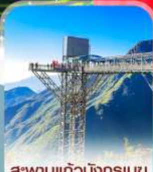
สะพานแก้วมังกรเมฆ