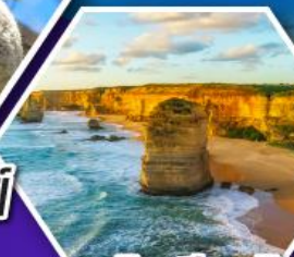
เกรทโอเซียนโรด