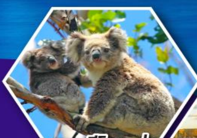
ชมหมีโคอาล่า ณ สวนสัตว์ซิดนีย์