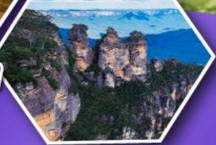
อุทยานบลูเมาส์แท่น