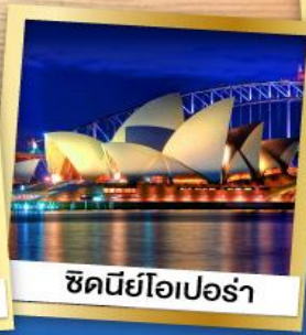
ซิดนีย์โอเปอร์รา