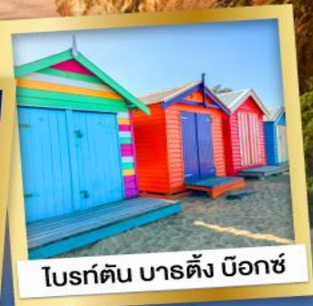
โบรด์ตัน บาร์ตัง บ็อกซ์