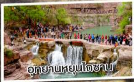
อุทยานหยุนโกซาน