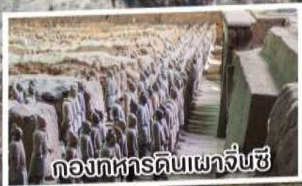
คองกหารดินเผาจิ๋นซี