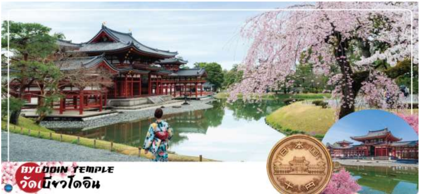
BYODOIN TEMPLE วัดเบียวโดอิน

นำท่านเดินทางสู่ เมืองอุจิ (Uji) เมืองเล็กๆ ทางตอนใต้ของเกียวโตหนึ่งในแหล่งปลูก "ชาเขียวอุจิ" ที่ดีที่สุดในญี่ปุ่น ซึ่งมีแม่น้ำอุจิสายสำคัญ และเป็นต้นกำเนิดของวัฒนธรรมเก่าแก่ต่างๆ