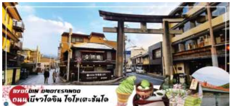
BYODOIN OMOTESANDO ถนนเบียวโดอิน โอโมเตะซันโด

เมื่อท่านเดินทางสุดถนนแล้ว จะเจอ สะพานอุจิ (Uji Bridge) หนึ่งในสามสะพานเก่าแก่ที่สุดในญี่ปุ่น สร้างขึ้นในปี ค.ศ. 646 อายุคร่าวๆ ประมาณ 1,370 ปี เกือบพังทลายมาแล้วหลายครั้งจากสงคราม น้ำท่วม และแผ่นดินไหว แต่ทุกครั้งชาวเมืองก็ร่วมพลังกันซ่อมแซมจนกลับมาใช้งานได้อีกครั้ง และยึดหยัดมาจนถึงวันนี้ กลายเป็นมรดกทางประวัติศาสตร์ของชาวเมืองอุจิ