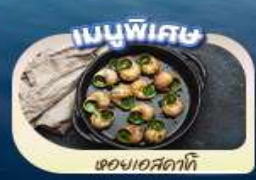
ของแถมสดๆ

เดินทาง 9 - 16 พ.ค.68 19 - 26 พ.ค.68 26 พ.ค. - 2 มิ.ย.68