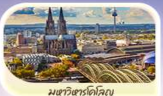
มหาวิหารโคโลญ