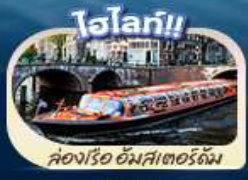
คลองเรือ อัมสเตอร์ดัม

“ตำนานเด็กยืนดี สัญลักษณ์แห่งกรุงบรัสเซลส์ แมนเนเกน ฟิส มหาวิหารโคโลญ” สะพานไออินชอลเลิร์น ส่งเรือชมหมู่บ้านทีโรน กังหันลมซานส์คินส์ คลองอัมสเตอร์ดัม บรัสเซลส์ อะโดเมียม จัตุรัสบรูจส์ หอไอเฟล จัตุรัสคองคอร์ด พิพิธภัณฑ์ลูฟร์ ส่งเรือแม่น้ำแซน ซุปป์ิงแบบจุใจที่ห้างซิน่า