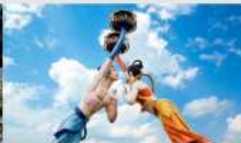
Wulong Flying Kiss