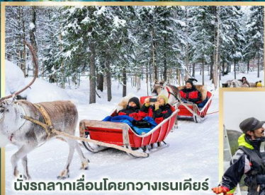
นั่งรถลากเลื่อนโดยกวางเรนเดียร์