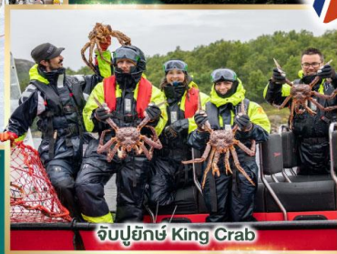
จับปูยักษ์ King Crab