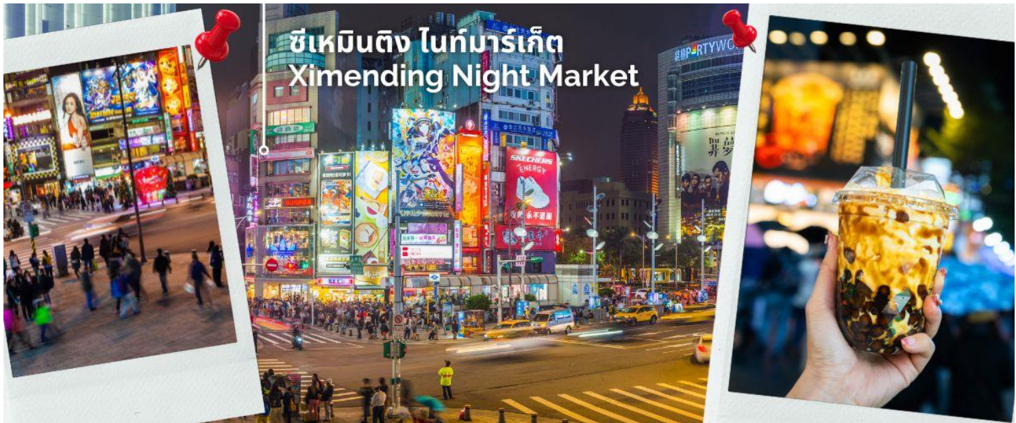
ซีเหมินติง ไนท์มาร์เก็ต Ximending Night Market

คำ อิสระอาหารค่ำ เพื่อให้ทุกท่านเต็มกับการช้อปปิ้งซึ่งไกด์จะแนะนำร้านอาหารร้านเด็ดร้านอร่อยให้