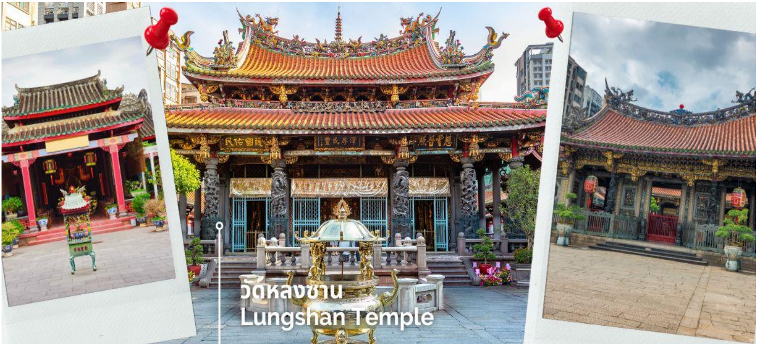
วัดหลงซาน Lungshan Temple

นำท่านแวะชมของที่ระลึก ผลิตภัณฑ์สร้อย Germanium ซึ่งทำเป็นเครื่องประดับทั้งสร้อยคอและสร้อยข้อมือ