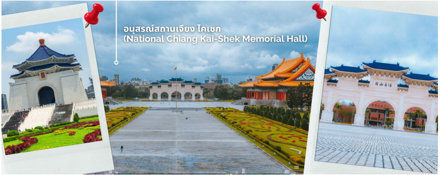
อนุสรณ์สถานเจียง ไคเชก (National Chiang Kai-Shek Memorial Hall)

ถูกสร้างขึ้นมาตามแบบสถาปัตยกรรมจีนโบราณ บันไดทั้งสี่ด้านถูกสร้างด้วยหินอ่อนสีขาวเป็นขั้นตามแบบ พีระมิดอียิปต์ หลังคาสีน้ำเงิน รวมทั้งยังมีสวนดอกไม้สีแดง ที่เป็นการแสดงออกทางสัญลักษณ์ให้เห็นถึง อิสรภาพ ความเท่าเทียม และความเป็นหนึ่งเดียวกัน ตามสีของธงชาติไต้หวัน