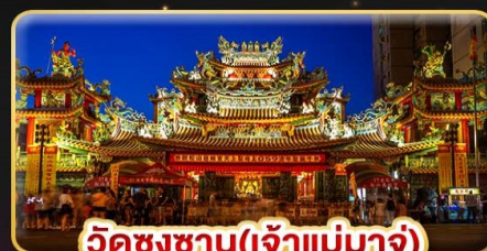
วัดชงชาน(เจ้าแม่มาจู่)