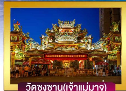
วัดชงชาน(เจ้าแม่มาจู่)