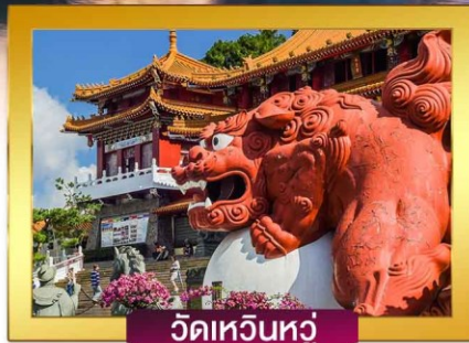
วัดเหวินหัว