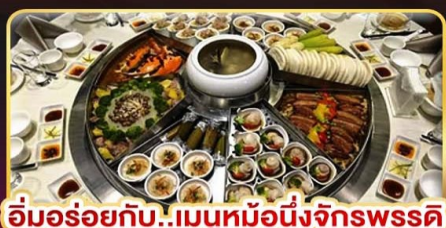
อิ่มอร่อยกับ..เมนูหม้อหนึ่งจักรพรรดิ เสี่ยวหลงเปา ซาซิมูฟุไฟสไตส์ได้หวิน