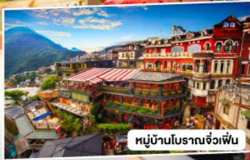
หมู่บ้านโบราณจั๋วเฟิ่น