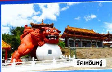
วัดเหวินหู่

อาลีซาน ทะเลสาบสุริยันจันทรา จั๋วเฟิ่น 5วัน 3คืน