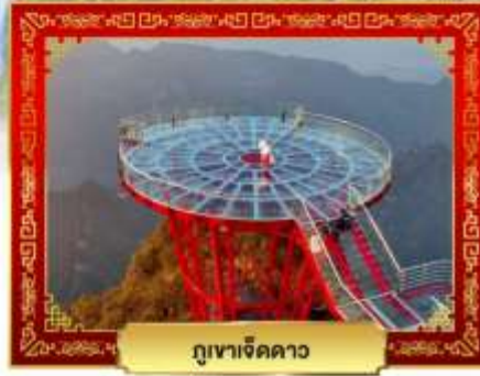
ภูเขาจิดดาว