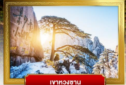
ภูเขาหวงซาน