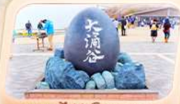
หุบเขาไฟห้าโอวาคุดานิ