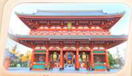
วัดฮาซาทสึ