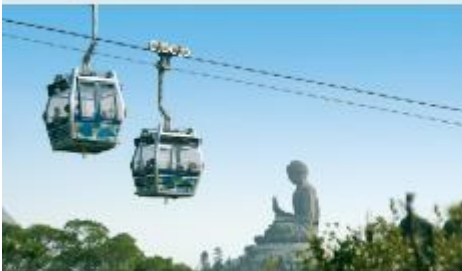
กระเช้าองปิง