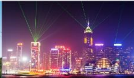
Symphony of Lights