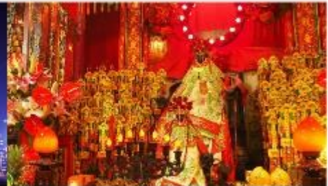
วัดเจ้าแม่กวนอิมของซ่า

*ทางบริษัทฯ ขอสงวนสิทธิ์ในการล้นโปรแกรมทัวร์ตามความเหมาะสมขึ้นอยู่กับสถานการณ์ปัจจุบัน โดยคำนึงถึงผลประโยชน์ของลูกค้าเป็นสำคัญ