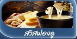
สวิสฟองดู