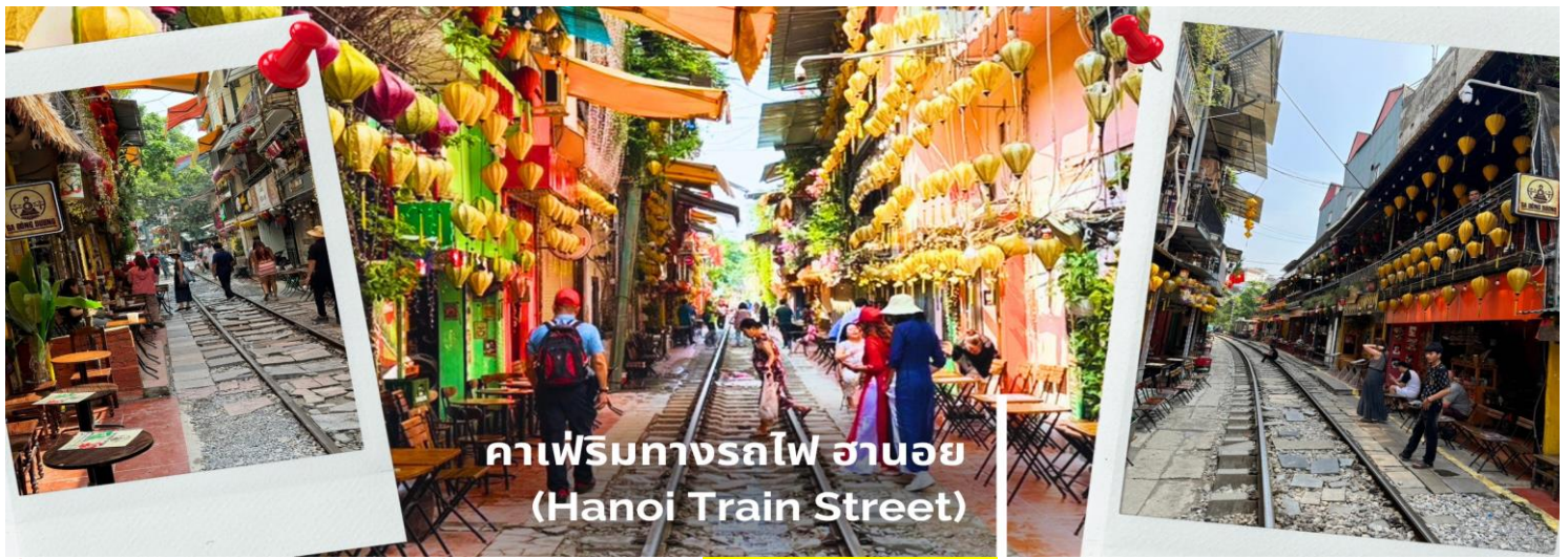
คาเฟ่ริมทางรถไฟ ฮานอย (Hanoi Train Street)

ค่ำ รับประทานอาหารค่ำ ณ ภัตตาคาร (10) บุฟเฟ่ต์อาหารนานาชาติ