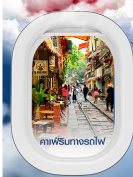
คาเฟ่ริมทางรถไฟ