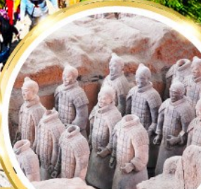
กองทัพทหารดินเผาจีนซี