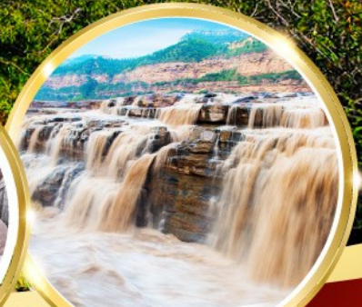
น้ำตกหูโข่ว