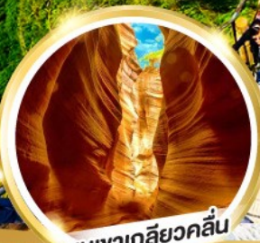
หุบเขาเกลียวคลื่น