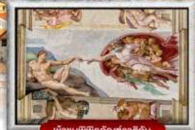
เข้าชมพิพิธภัณฑ์ทิวาติกัน

เมนูพิเศษ! สปาเกตตี้เส้นหมึกดำ, พิชซ่าสไตล์อิตาลีแบบแท้