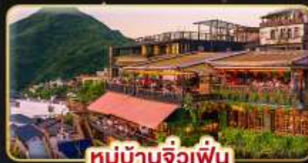
หมู่บ้านจิวเฟิ่น