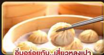
อิ่มอร่อยกับ..เสี่ยวหลงเปา

พิเศษ !! หม้อนึ่งจิกสวรดี้ , ไอศกรีม MIYAHARA