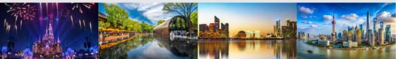
เชียงใหม่ดีสนีย์แลนด์