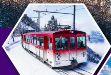
นั่งรถไฟใต้เขาริกิ