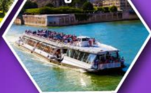
ล่องเรือบาโตมุช ชมกรุงปารีส

เที่ยวเมืองวาตูซ เมืองหลวงของสาธารณรัฐ ลิกเทนสไตน์