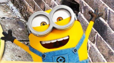
เริ่มต้น

เมนูสุดพิเศษ!! เปิดปักกิ่ง, สุกี่มองโกล, อาหารกวางตุ้ง, อาหารเสฉวน