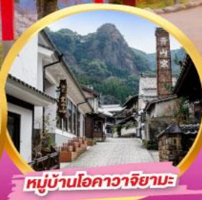
หมู่บ้านโอคาวาจิยามะ