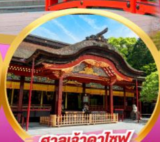
ศาลเจ้าคาไซฟู