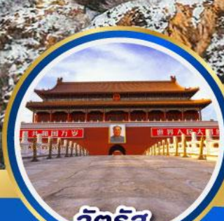
จัตุรัส เทียนอันเหมิน