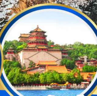
พระราชวังฤดูร้อน อ้อหอหยวน