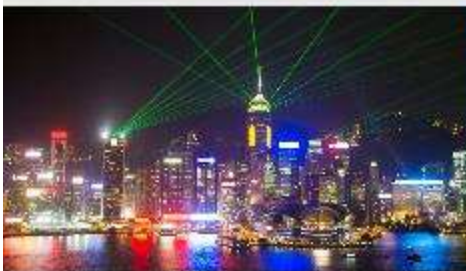
Symphony of Lights