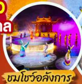
ชมโชว์อลังการ