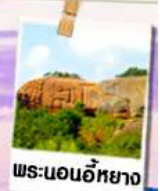
พระนอนอภัยชา