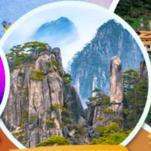
ภูเขาหวงชาน