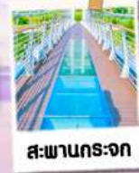
สะพานกระจก