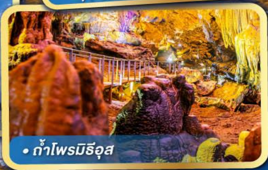
• ถ้ำไฟรมีริอัส