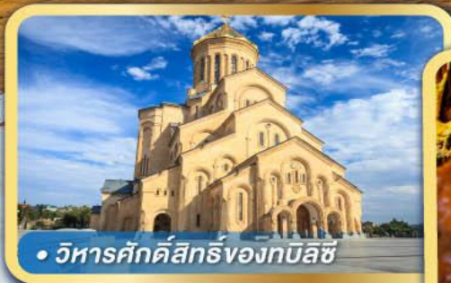
• วิหารศักดิ์สิทธิ์ของทมิลชี