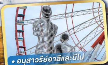
• อนุสาวรีย์อาลีและนีโน