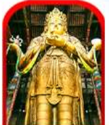
วัดกานดา