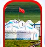
หมู่บ้าน พื้นเมือง