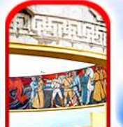
อนุสาวรีย์ ไซซาน