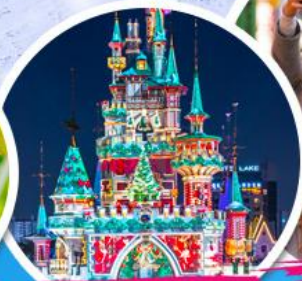
สวนสนุกกล็อดเต้