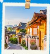
หมู่บ้านนูกซอน