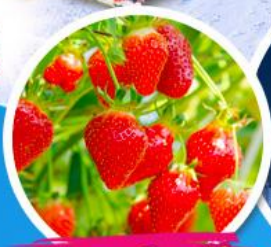
ไรสตอร์เบอร์รี่