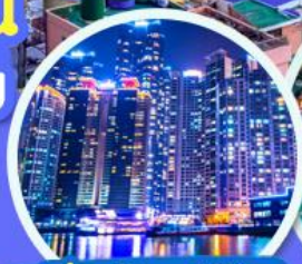
The Bay 101