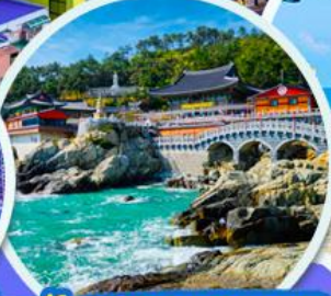
วัดแฮดง ยงกุงซา