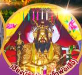
เซียงบูซิว (ศาลเจ้าพ่อเสือ)

เมนูพิเศษ!! อาหารแต่จิว 18 อย่าง ห้ามพลาด! ดินตำรับชวงเคา สุกชีฟู๊ด