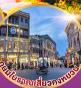
ถนนโบราณเสี่ยวกงหยวน