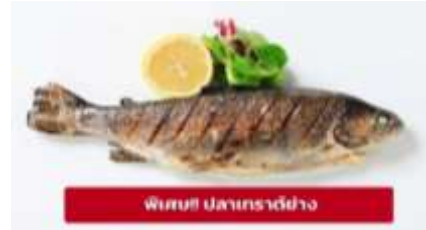
พิเศษ! ปลาเทราต์ย่าง

เย็น ๑๐ รับประทานอาหารเย็น (มื้อที่4) ที่พัก : Gartenhotel Maria Theresia Hall หรือโรงแรมและเมืองระดับใกล้เคียงกัน (ชื่อโรงแรมที่ท่านพัก ทางบริษัทจะทำการแจ้งพร้อมใบนัดหมาย 5-7 วัน ก่อนวันเดินทาง)