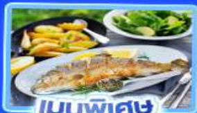
เมนูพิเศษ ปลาเทราดย่าง

อัลสส์ตัทท์ เวียนนา อินส์บรุค ปราสาทนอยชวาสไตน์ ลูเซิร์น ริก