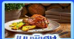
เมนูพิเศษ ขาหมูเยอรมัน