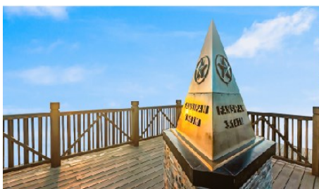
ยอดเขาฟานซิปัน