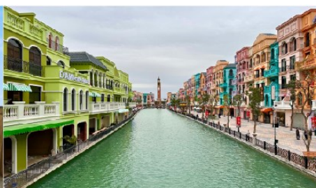
เมก้าแกรนด์เวิลด์ฮานอย