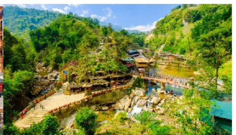
หมู่บ้านก๊อต ก๊อต

*ทางบริษัทฯ ขอสงวนสิทธิ์ในการสลับโปรแกรมทัวร์ตามความเหมาะสมขึ้นอยู่กับสถานการณ์หน้างาน โดยคำนึงถึงผลประโยชน์ของลูกค้าเป็นสำคัญ