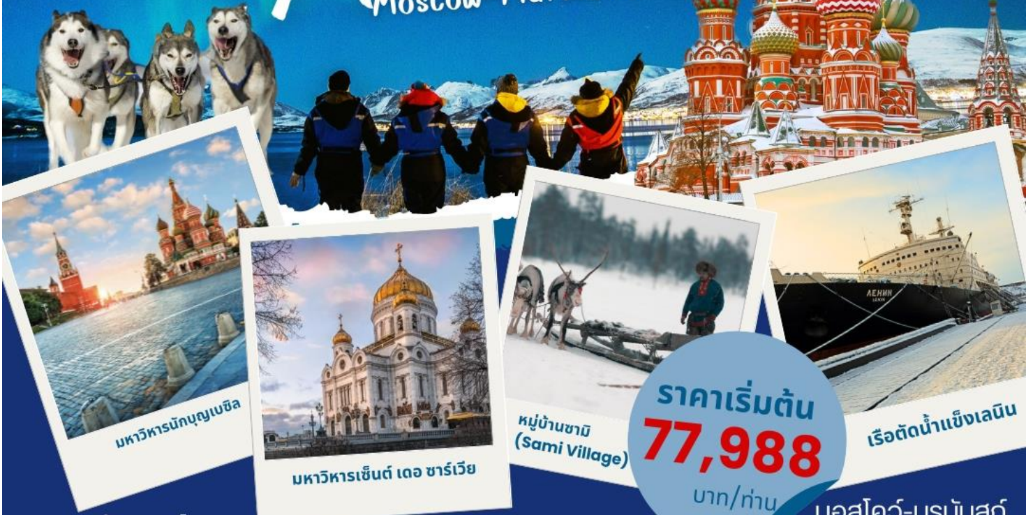
มหาวิทยาลัยมูมบาเซิล