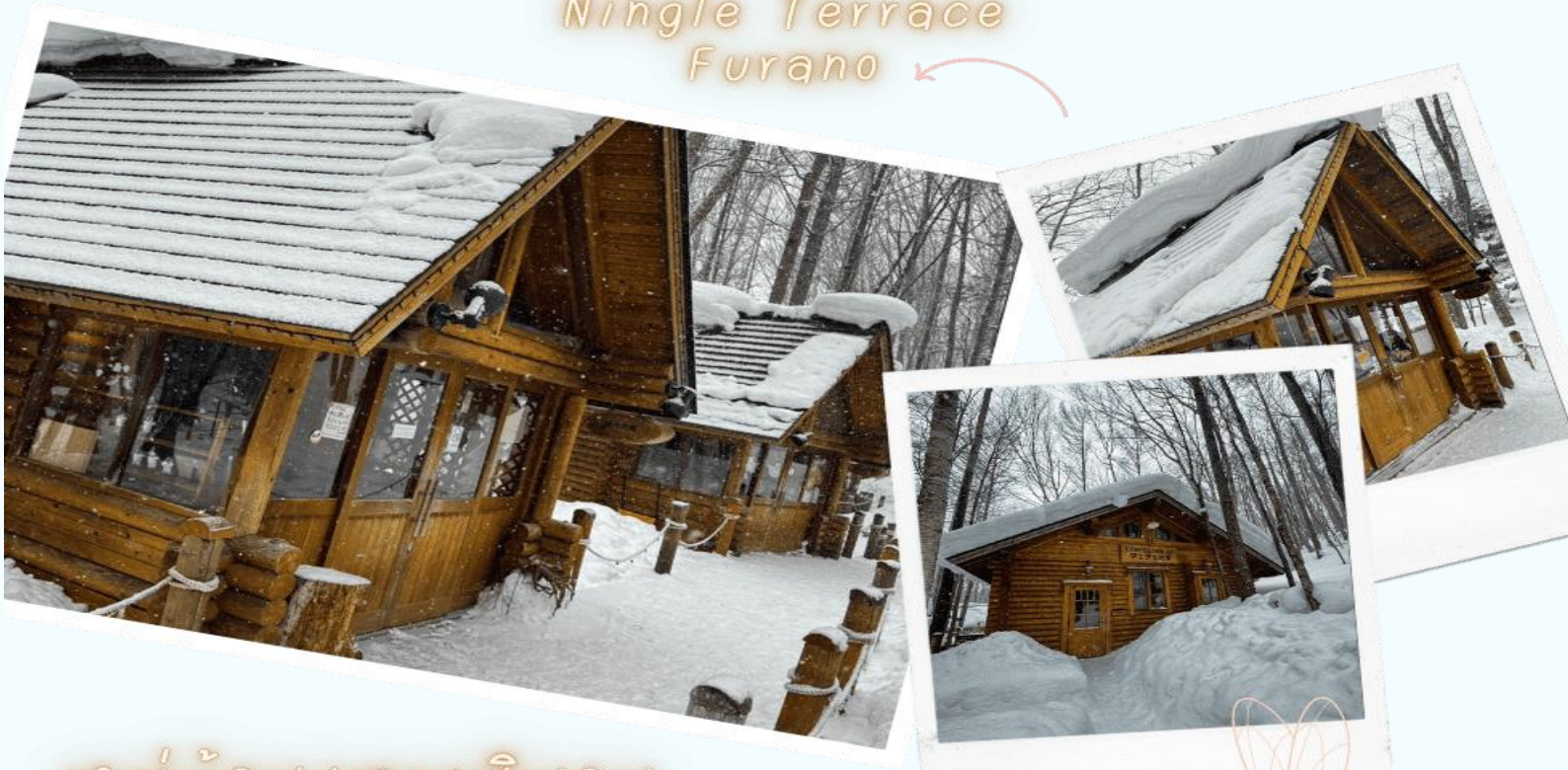
หมู่บ้านเทพนิยาย หิมะเกล็ดเทอเรส