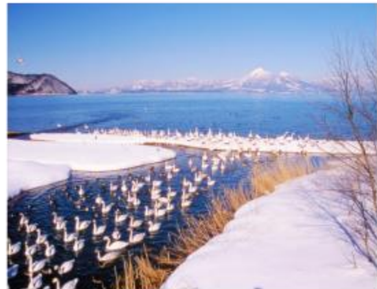
ทะเลสาบอินาวะชิโร Inawashiro-ko