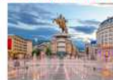
เมืองนิส