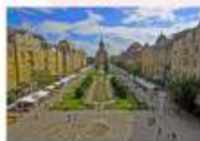
เมืองซีบีอู