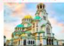
Alexander Nevsky Cathedral

15.45 น. ออกเดินทางสู่สนามบินอิสตันบูล เที่ยวบิน TK1032