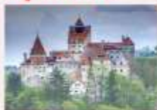
เมืองบราซอฟ