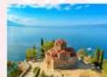
St. John at Kaneo Church

** พักที่ Hotel Holiday Inn 4* หรือเทียบเท่า **