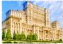
เมืองบูคาเรสต์