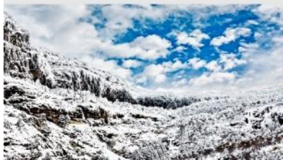
ภูเขาหิมะเจี้ยวจื่อ