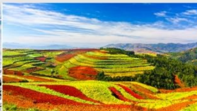
แผ่นดินสีแดง