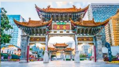
ประตุม้าทอง ไก่อหยก

*ทางบริษัทฯ ขอสงวนสิทธิ์ในการสลับโปรแกรมทัวร์ตามความเหมาะสมขึ้นอยู่กับสถานการณ์หน้างาน โดยคำนึงถึงผลประโยชน์ของลูกค้าเป็นสำคัญ