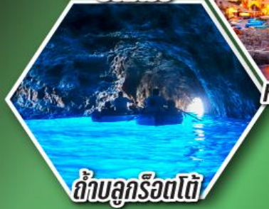
ดำบลูกรोटโต้