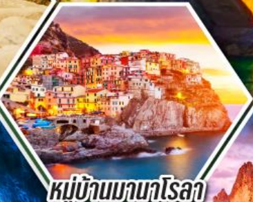
หมู่บ้านมามาโรลา