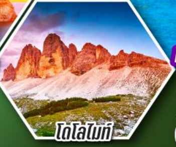
โตโลโมเท

โปรแกรมเที่ยว เก็บครบรอบ อิตาลี ตั้งแต่เหนือถึงใต้