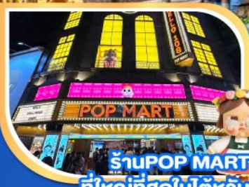
ร้าน POP MART ที่ใหญ่ที่สุดในโลกไต้หวัน