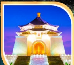
เจียงโคเช็ก